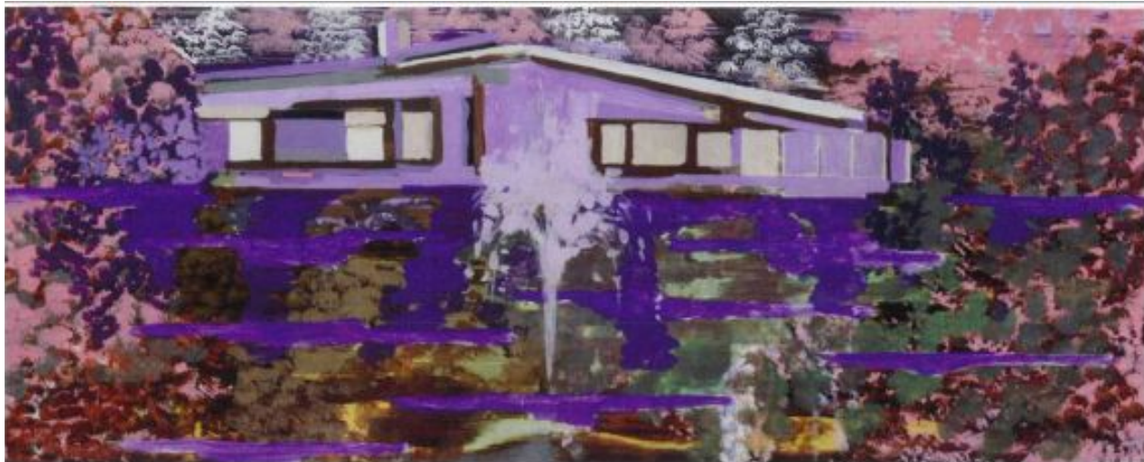
Nr. 02-069 (2010), acryl op doek, 90 x 180 cm. 'Alles telt mee: de druipers, de vlekken. In die zin speelt het toeval een rol in mijn werk. Anders ben je alleen maar een idee aan het verwezenlijken. Maar de controle daarover blijft essentieel'

'Als je schildert, raak je in een flow. Dan heb je geen buitenwereld meer nodig'