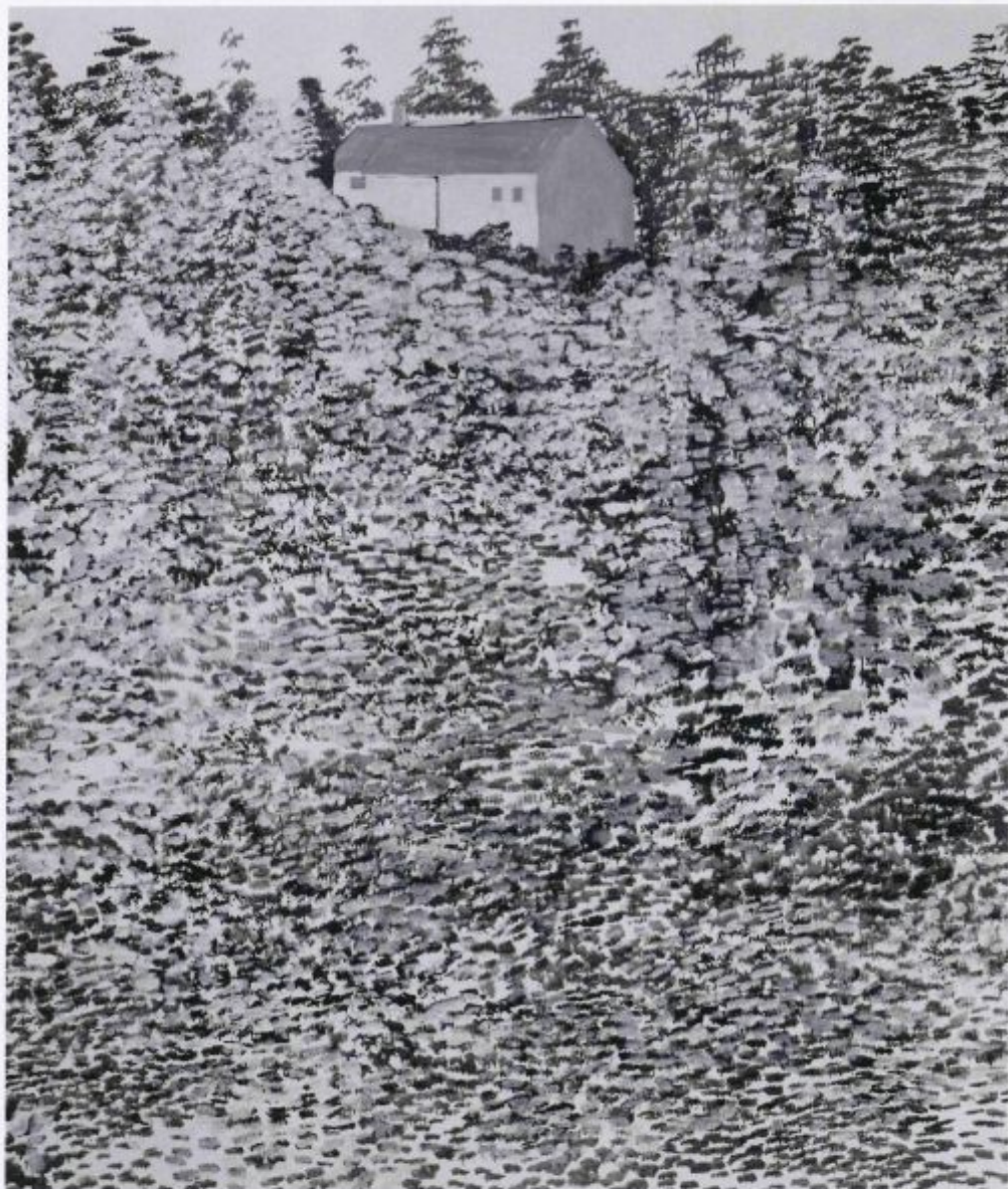
soven Nr. 02-068 (2010), acryl op doek, 170 x 150 cm. 'Mij gaat het om de echte schoonheid, Maar tegelijk om de mens in nederigheid van de grote natuur - mooi en angstaanjagend tegelijk.' ΣΧΟΛΗΤΗΣ